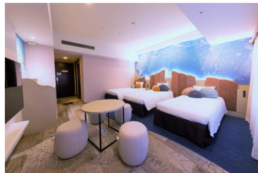
【リニューアル】スタンダードルーム(左)、スーペリアルーム(右)