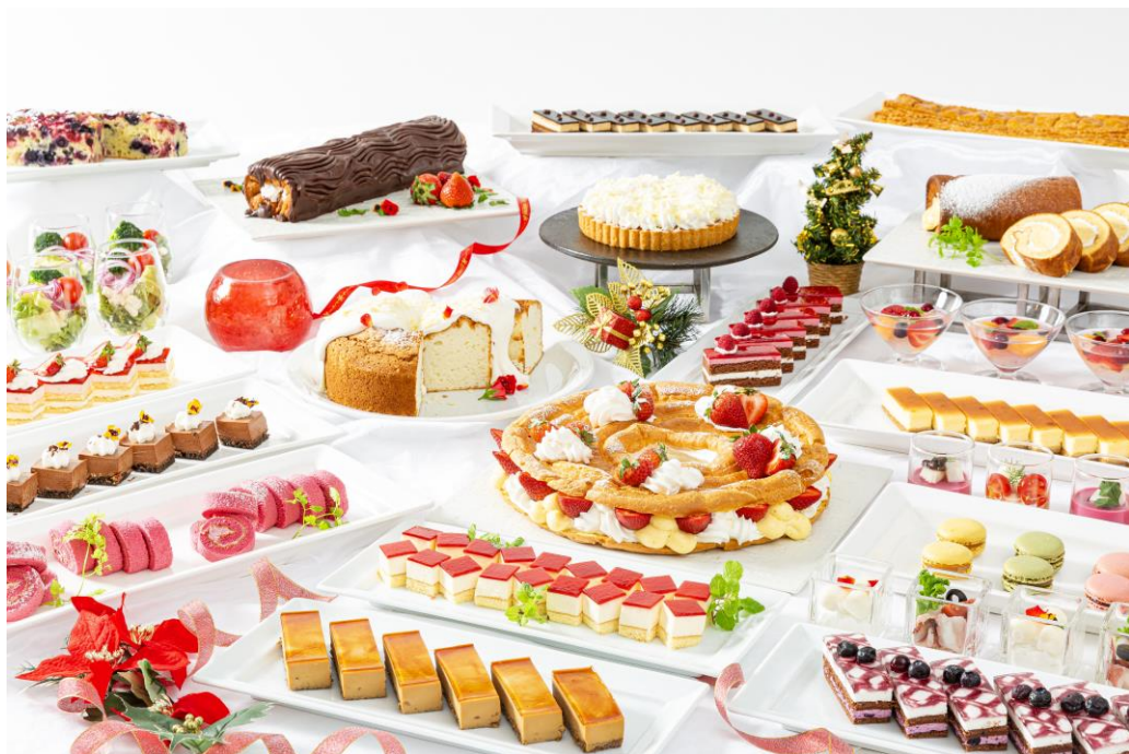
スイーツビュッフェメニュー(イメージ)

また、新春はご家族皆さままでお楽しみいただけるビュッフェをランチタイム、ディナータイムともに開催いたします。お正月もぜひロレーヌをご利用ください。