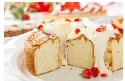
ホワイトチョコレートとベリーの パウンドケーキ