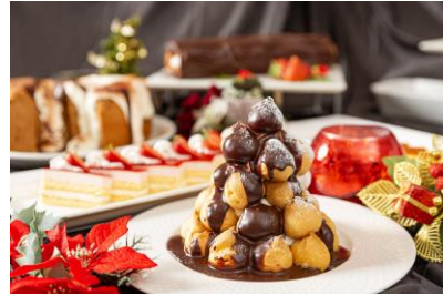
クリスマスディナービュッフェ料理(イメージ)