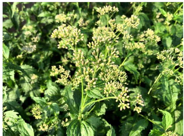
つぼみが色づき始めた御室仁和寺駅のフジバカマ