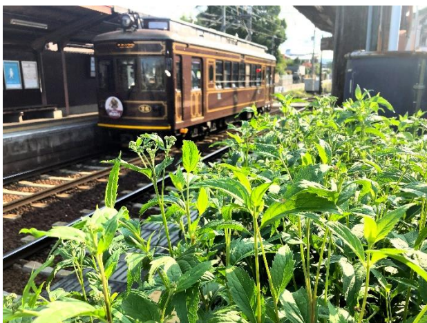
等持院・立命館大学衣笠キャンパス前駅のフジバカマ

嵐電の10駅に設置したフジバカマは、まもなく開花時期の10月を迎えます。7月に設置して以降、お世話をしてくださった沿線地域の皆様、見守ってくださった駅ご利用のお客様、多くの皆様にお礼を申し上げます。