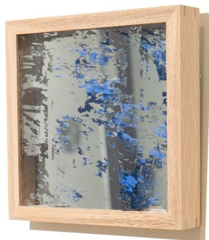
写真左「reselfie 3」(部分) photo by kaori yamane、写真右「エンドレス 1」photo by CHIHO HIRAGI