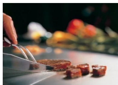
ディナーイメージ