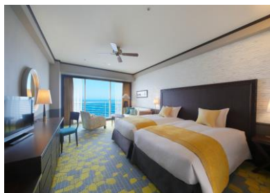
客室 Lumina イメージ

プロポーズの後は、スタッフがお部屋にケーキをお届けします。幸せの余韻にゆっくりと包まれるひとときをお過ごしください。ご宿泊のお部屋は「光・輝き・煌めき」をイメージしたデラックスフロアの「Lumina」をご用意。目覚めると、きらきらと輝く雄大な琵琶湖がお二人を祝福してくれることでしょう。チェックアウトの際に「ハレの日コンシェルジュ」より記念に「プロポーズ証明書」をプレゼントいたします。