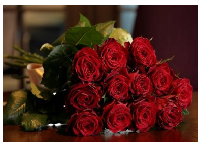
ダズンローズイメージ

本プランでは、プロポーズの演出として「ダズンローズ」をご用意。「ダズン」＝「12」のバラは、「感謝、誠実、幸福、信頼、希望、愛情、情熱、真実、尊敬、栄光、努力、永遠」を表し、12本のバラを贈ることで、その全てをパートナーに誓うという意味が込められています。オプションで「永遠（とわ）」を意味する 108本のバラのご用意も可能です。