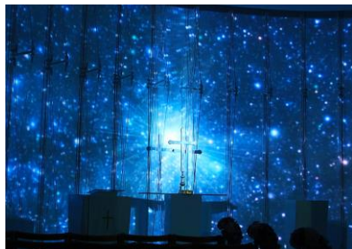
チャペル演出イメージ

食事の後は、いよいよプロポーズ。「チャペルでプロポーズプラン」では、スタッフがさりげなくお二人を静かな夜のチャペルにいざないます。ご希望によりオプションでミナラキャンドルや、壁全体 360 度を包み込む圧巻のプロジェクションマッピングによる映像演出も可能です。「宿泊ルームでプロポーズ」プランでは、ベッドをバラでデコレーション。まるで映画のワンシーンのような、一生の思い出となる大切なひとときを盛り上げます。