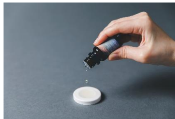
オリジナルアロマオイル 5ml & ストーンセット 2,950 円 (税込)