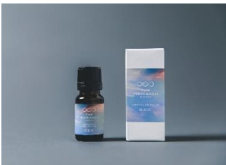
オリジナルアロマオイル 10ml 3,600 円(税込)