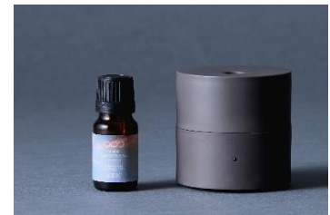
オリジナルアロマオイル 10ml & ファンディフューザー-kō (コウ) セット ¥6,900 (税込)