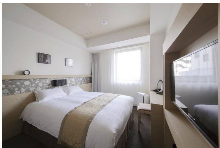
ホテル京阪 淀屋橋 客室（一例）