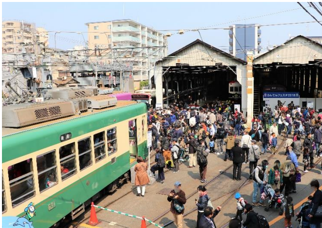
らんでんフェスタ 2018