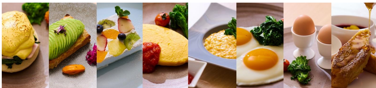
※メインディッシュ イメージ

※表示価格には、サービス料 13%と消費税が含まれております。 ※メニュー内容および食材の産地等は仕入れの都合により変更になる場合がございます。 ※営業時間等は予告なく変更になる場合がございます。詳しくは公式 HP をご確認ください。 ※写真は全てイメージです。