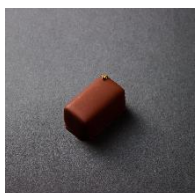
ほうじ茶とキャラメル