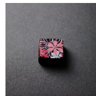
ピスタチオとラズベリー