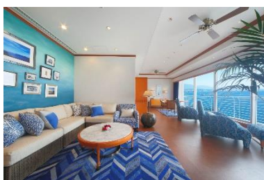
「ロイヤルスイート」 100㎡