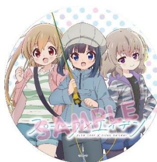
コラボヘッドマーク、ラッピングのイメージ