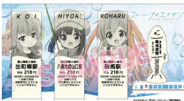
コラボきっぷのイメージ