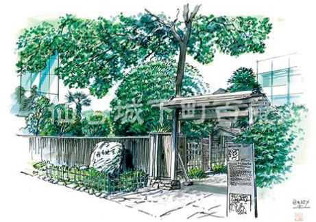
展示作品イメージ

実施期間： 2022年10月1日（土）～ 場 所： ホテル京阪 仙台 1階ロビー 展示作品： 「仙台城下町百景」より3作品を展示 （3ヶ月ごとに展示作品を変更） ※無料でご覧いただけます。