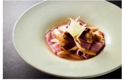
温物（牛ローズ吉野仕立て）

【実施期間】2022年9月1日(木)～10月30日(日) ※前日 15:00 までに要予約 ※50食限定メニューにつき、期間内であっても販売を終了する場合がございます。