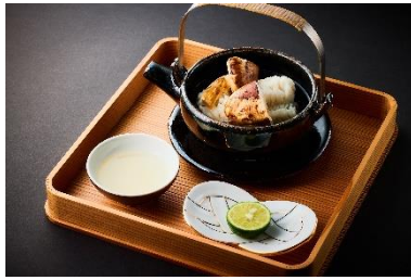
お吸物（鱧と松茸の土瓶蒸し）