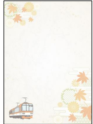
限定台紙デザイン

新型コロナウイルスの感染拡大状況により、拝観休止等内容を変更する場合がございます。その際は、随時、叡山電車公式ホームページおよび叡山電車公式Twitterにてご案内いたします。