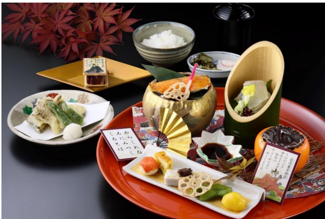
「日本料理 おおみ」百人一首ランチ 秋の宴（イメージ）

琵琶湖ホテル（所在地：滋賀県大津市浜町、総支配人：前田義和）は、2022年9月5日（月）から12月4日（日）までの期間、2階「日本料理 おおみ」にて『百人一首ランチ 秋の宴』を、また、「バー ベルラーゴ」で『百人一首カクテル』第18弾となる新作オリジナルカクテル2点を販売します。