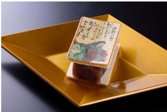
あも歌留多 (イメージ)