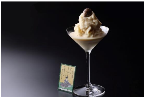
月みれば (イメージ)

「月みれば ちぢにもこそ 悲しけれ わが身一つの 秋にはあらねど」 【歌番号 23 大江千里】