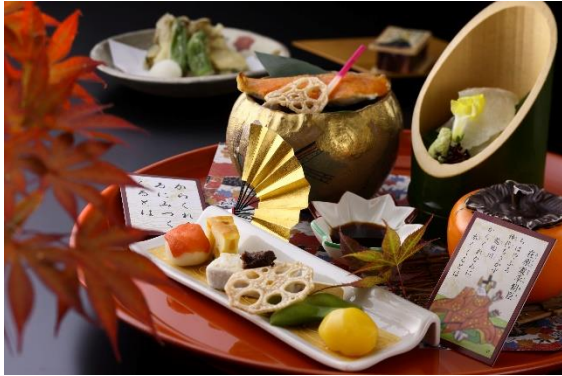
百人一首ランチ 秋の宴 (イメージ)

「日本料理 おおみ」の料理長が遊び心あふれる献立と色とりどりの盛り付けで百人一首の歌の世界を表現する四季替わりの『百人一首ランチ』。