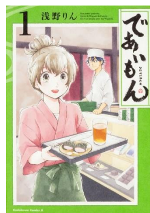
『であいもん』①巻書影