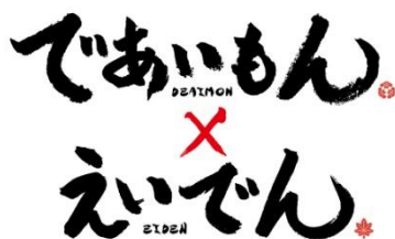
コラボロゴのイメージ