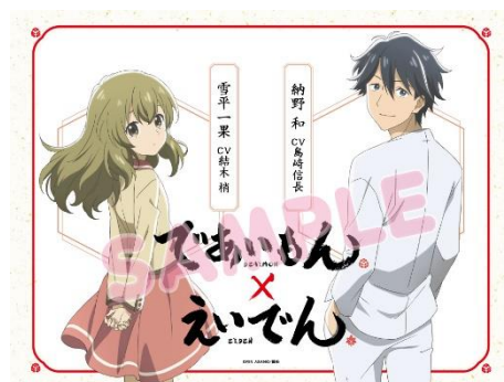
車内ドアラッピングのイメージ