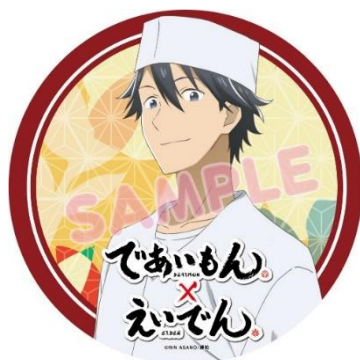
ヘッドマークのイメージ