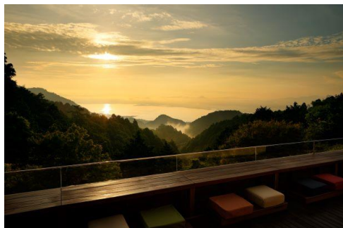
テラスからの日の出