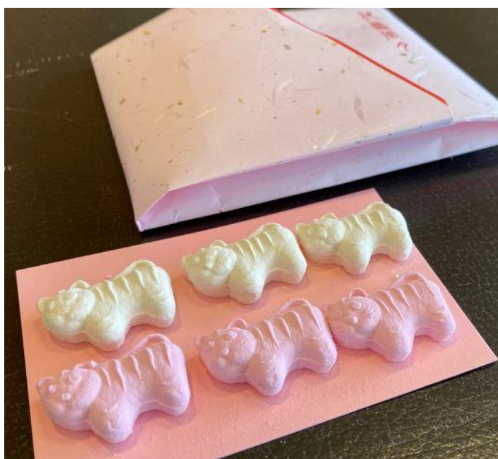
干支を象った干菓子（お部屋にご用意）