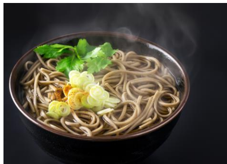
年越しそば（イメージ）