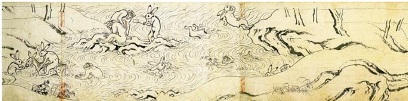
甲巻 巻頭)谷川で水遊びをする兎、猿、鹿を描く

高山寺を代表する国宝である。現状は甲乙丙丁4巻からなる。甲巻は擬人化された動物を描き、乙巻は実在・空想上を合わせた動物図譜となっている。丙巻は前半が人間風俗画、後半が動物戯画、丁巻は勝負事を中心に人物を描く。甲巻が白眉とされ、動物たちの遊戯を躍動感あふれる筆致で描く。甲乙巻が平安時代後期の成立、丙丁巻は鎌倉時代の制作と考えられる。