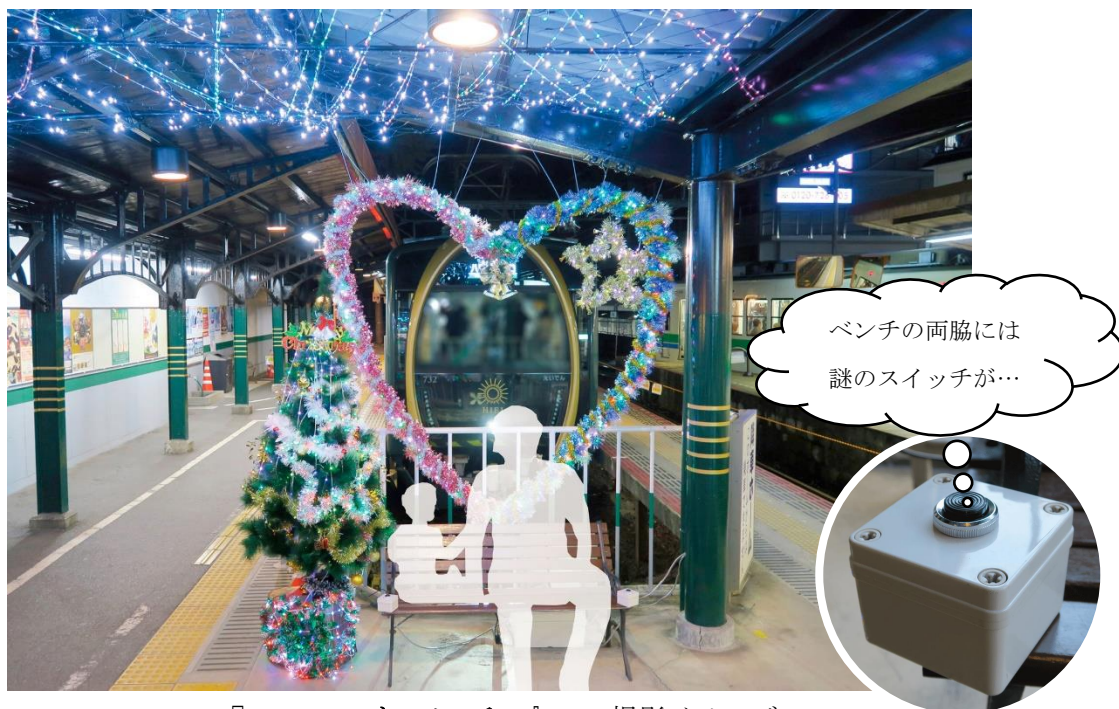
『 LOVE な ベンチ! 』での撮影イメージ

電車をバックに、老若男女を問わずそれぞれの愛情や感謝の気持ちを、思い出の一枚として撮影いただくとともに、末永く記憶に残していただければ幸いです。