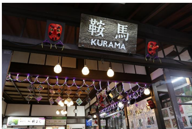
各駅の装飾のイメージ