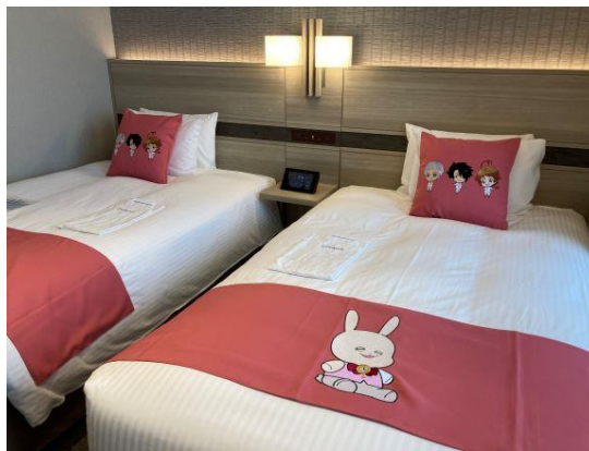
コンセプトルーム（Season1）イメージ