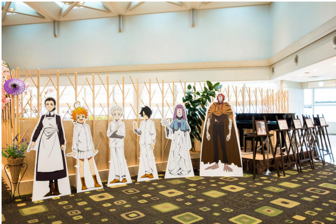
ロビー展示イメージ

(ホテル京阪 京橋 グランデでの展示の様子 (2021.6.1～9.30 実施))