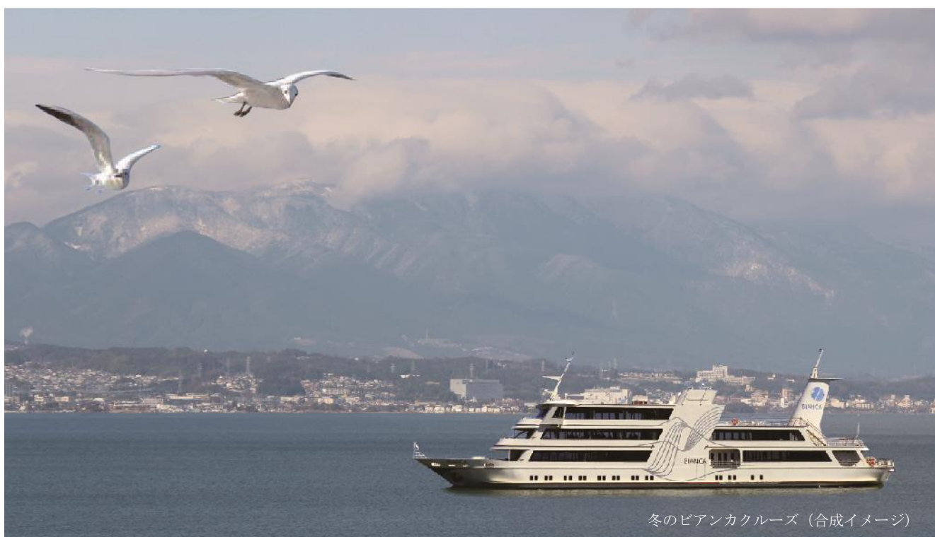
冬のピアンカクルーズ (合成イメージ)