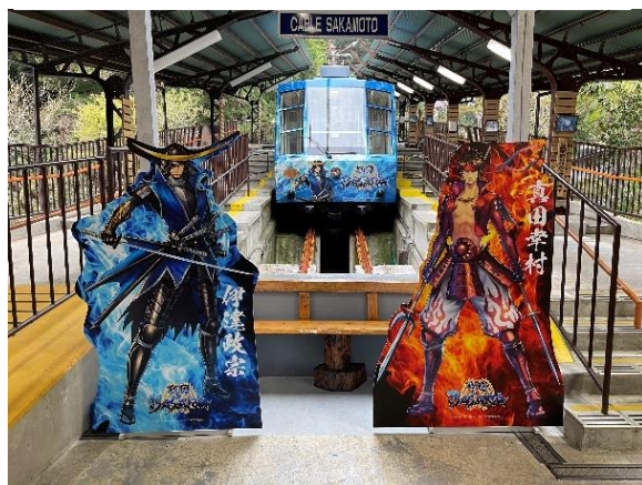
▲坂本ケーブル（戦国BASARA ラッピング 車両は、2021年12月26日まで運行）