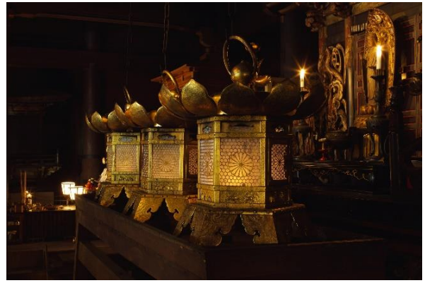
▲比叡山延暦寺・根本中堂（国宝）