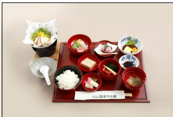
▲延暦寺会館でのお食事「精進懐石膳」