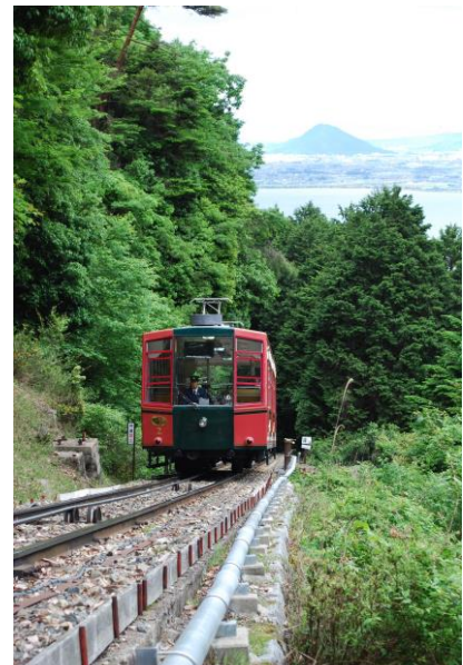
▲坂本ケーブルから三上山を望む (2022年1月より)