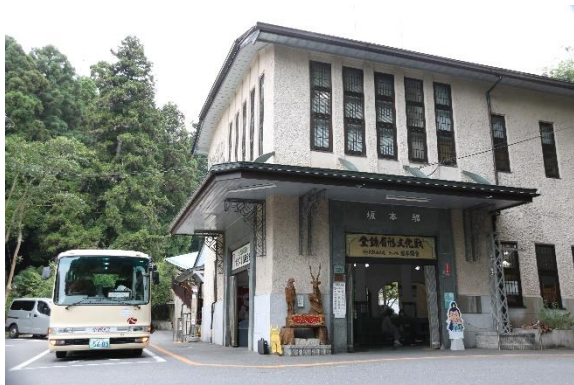
▲坂本ケーブル「坂本駅」（登録有形文化財）