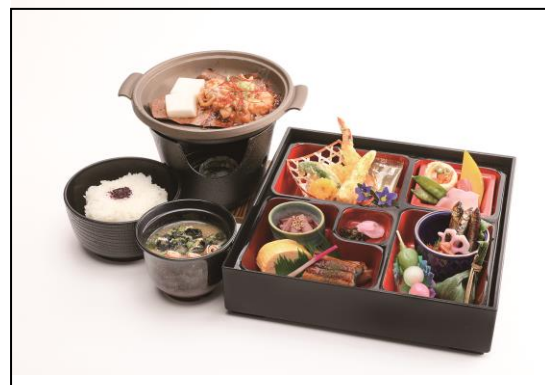
▲峰道レストラン&展望台でのお食事