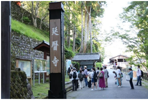
▲延暦寺巡拝所での説明