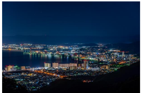
▲比叡山から望む夜景（大津市街地方面）