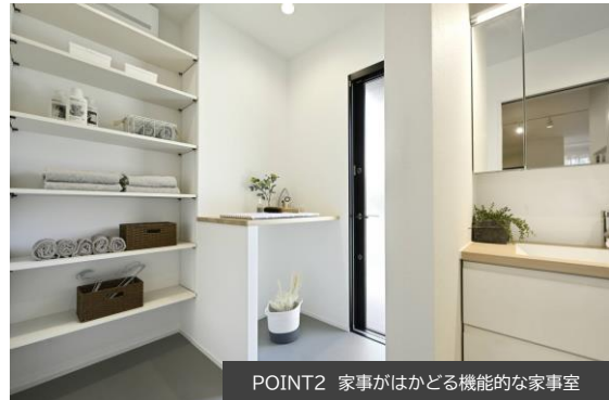
POINT2 家事がはかどる機能的な家事室