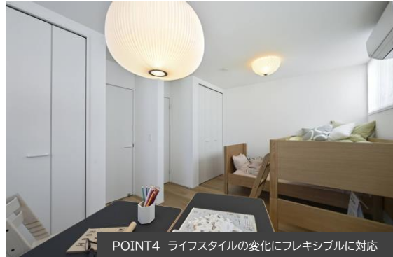
POINT4 ライフスタイルの変化にフレキシブルに対応