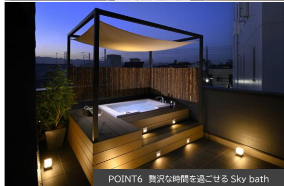
POINT6 贅沢な時間を過ごせる Sky bath