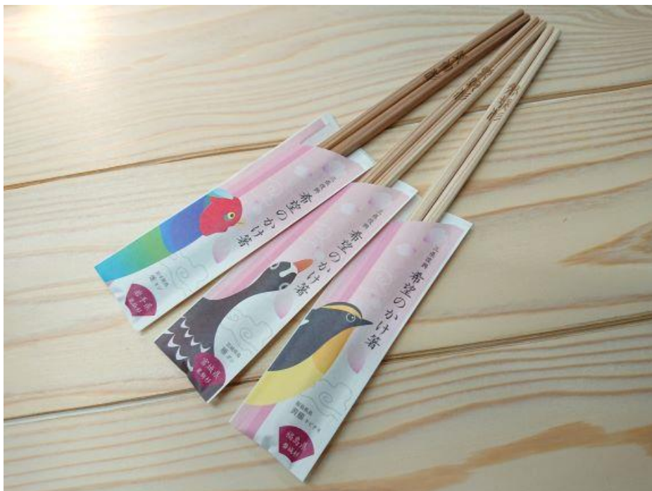
「希望のかけ箸」商品一例

国産の割り箸は間伐材、端材（丸太から建築用材を取った残り）等から製造され、環境にとっても優しい製品です。国内でみかける割り箸の95%以上は外国産木材でつくられているのに対し、磐城高箸でつくられている割り箸は、100%国産の杉材を使用しています。使用後の割り箸はボイラーで燃焼し新たな製品（割り箸）の乾燥に使われ、環境負荷ゼロに近づける努力をされているなど、循環型社会にも寄与しています。これらの事業活動は、ホテル京阪の経営姿勢の取り組みにも共通しており、またホテル京阪 仙台も東北をさらに元気になるよう一緒に盛り上げていきたいという思いから「希望のかけ箸」を一周年記念ノベルティとして選びました。フロントでは、三膳入りの割り箸の販売をいたしますので多くの方にご利用いただけることを願っています。