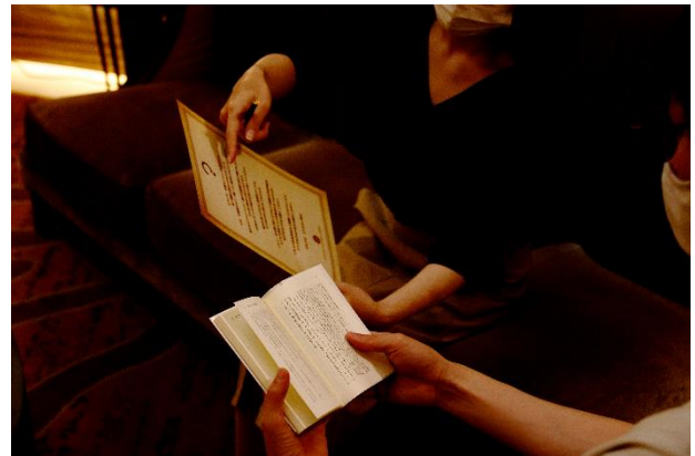
謎解きをする様子

本プログラムをご予約いただいた方には、チェックイン時にお渡しする1冊の本のストーリーに沿って自身の足でホテル内を探索し、数多くの暗号や謎を解き進めていただきます。奇妙な物語の主人公になったつもりで、その物語のエピローグ(=結末)を探し当てる本格的な謎解きゲームをお楽しみいただけます。次第に物語にのめり込まれていくような没入感、謎を解き明かした時の爽快感、ホテルという舞台で味わう非日常感をお届けいたします。プログラム終了後は、当ホテルのオーセンティックバー「ESSEX」で、謎を解いた後の心地良い疲れを癒すオリジナルカクテル2種をご用意しております。謎解きの余韻に浸りながら充実したひとときをお過ごしいただけます。ホテルの新しい楽しみ方の1つとして、ご家族やご友人とご一緒に、またはおひとりでもご宿泊、ご参加いただけます。