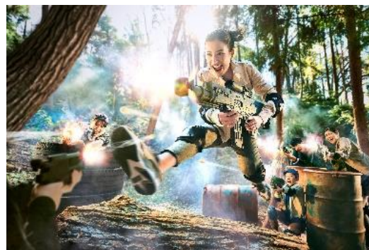
ガンバトル・ザ・リアル (ネスタリゾート神戸 新アクティビティ)