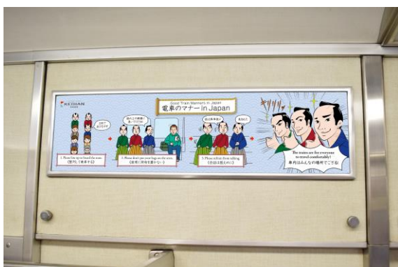
車内掲出イメージ