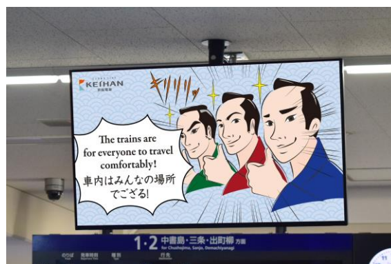
旅客案内ディスプレイ掲出イメージ