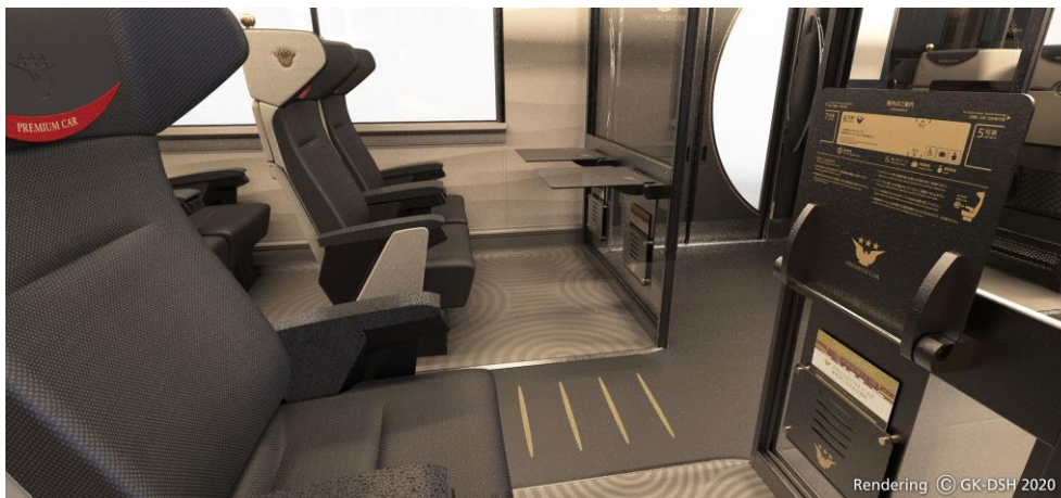
▲エントランス部ガラス仕切り壁への大型テーブル設置