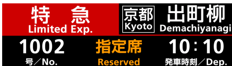
▲行先表示器(表示部拡大)