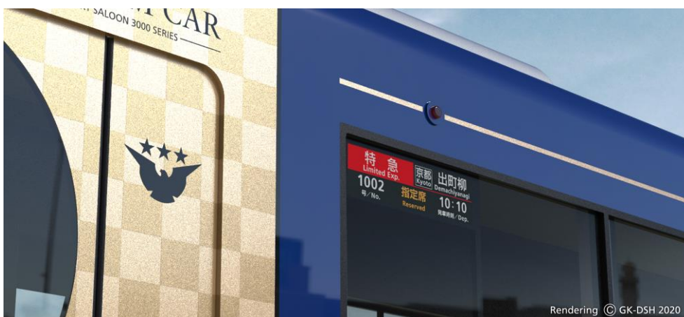
▲側窓ガラス層間に内蔵した行先表示器

複層ガラスの層間に液晶ディスプレイを内蔵した「inforverre Window シリーズ Bar タイプ」(※2)を鉄道車両の窓用ガラス(車外向け)として世界で初めて採用(※3)しました。また、車内の案内表示器にも「inforverre」を採用しています。