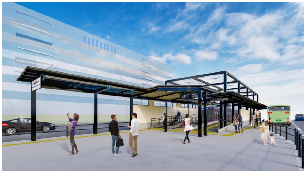
リニューアル後の北野白梅町駅(イメージ)