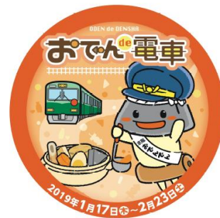
特製ヘッドマーク