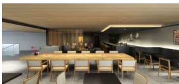
テーマは現代の茶会「TEA&BAR」