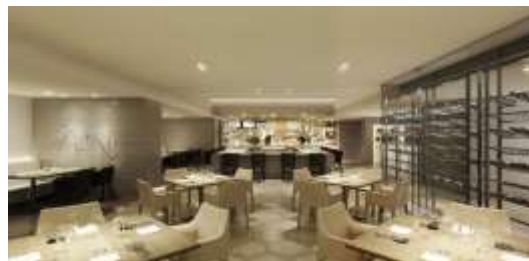
カウンターとテーブル2つの表情を持つ「SCALAE」