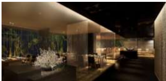
美味しさと庭園の美しさが魅力の「KIZAHASHI/階」

ただ、美味しいだけではない。喜び、楽しさ、驚き、発見、京都、文化・・・料理一皿ごとに、心躍る、ストーリーが宿るような、食を通しての体験・体感をすべてのお客さまにお届けします。食材は京都にとらわれず日本各地、世界中から、その時期に会える上質な一品をご提供します。