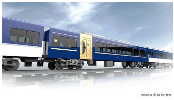
▲3000系プレミアムカー 外観デザイン(イメージ)