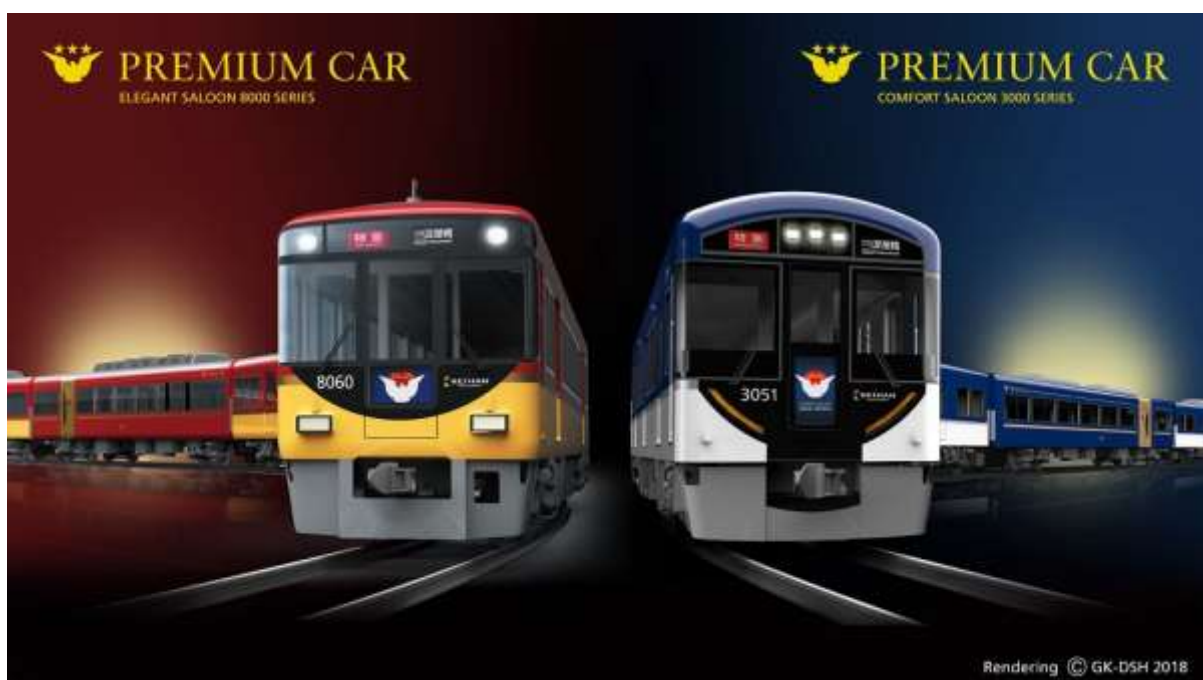
▲(左)8000系プレミアムカー、(右)3000系プレミアムカー(イメージ)