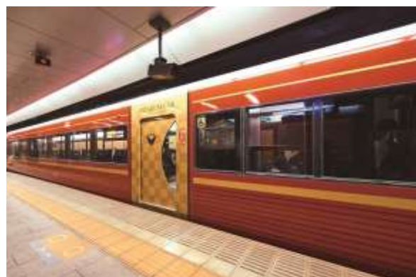
▲8000系プレミアムカー