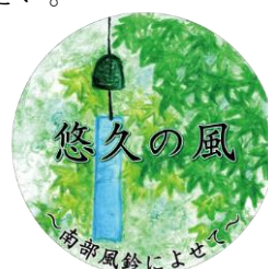
ヘッドマークデザイン