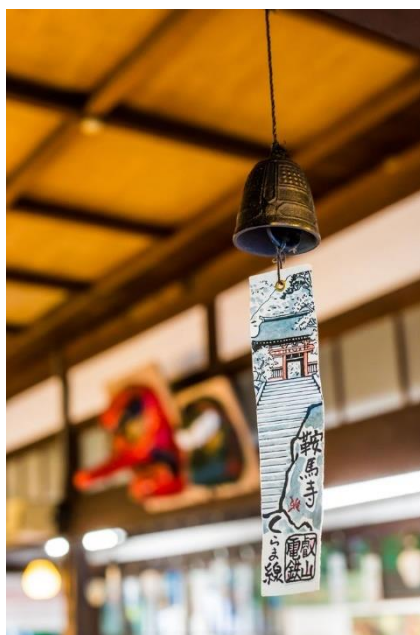
第5回悠久の風フォトコンテスト大賞作品

鞍馬は、源義経が牛若丸と呼ばれていた幼少期、天狗に武芸を教わり修行を積んだ地としても有名で、鞍馬寺には息つぎの水、背比べ石などが伝わっています。その後、義経は奥州平泉（岩手県）へと渡ったとされています。