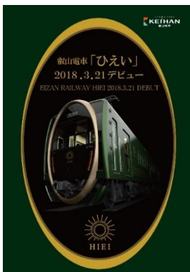
フラッグデザイン (イメージ)