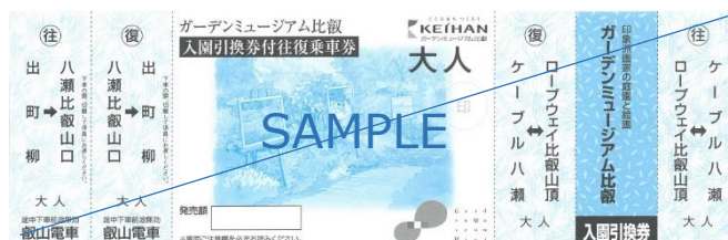
ガーデンミュージアム比叡入園引換券付往復乗車券のイメージ

今年は「ひえい」のデビューを記念して4月14日(土)～30日(月)に出町柳駅で「ガーデンミュージアム比叡入園引換券付往復乗車券」をお買い求めいただいたお客さまへ、幸運を呼ぶと言われている「四つ葉のクローバーの種」をプレゼントします。(プレゼントはガーデンミュージアム比叡の入園時に差し上げます)