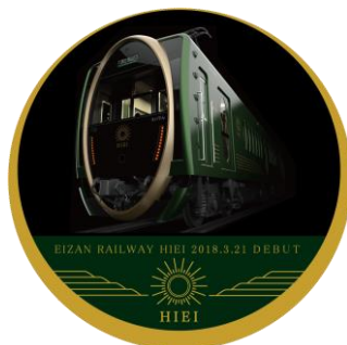
ヘッドマークデザイン (イメージ)

※運転時間は日によって異なります。また、車両点検やその他の理由により運休や運行期間終了日を変更することがありますのであらかじめご了承ください。