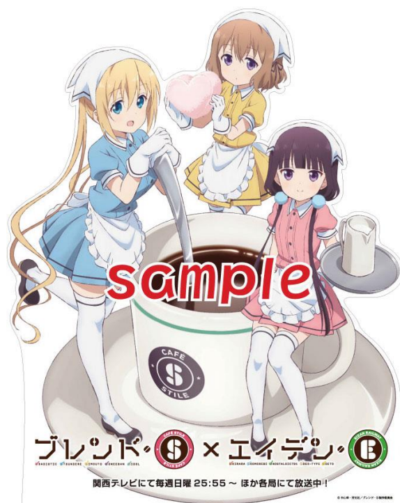
スタンディのイメージ