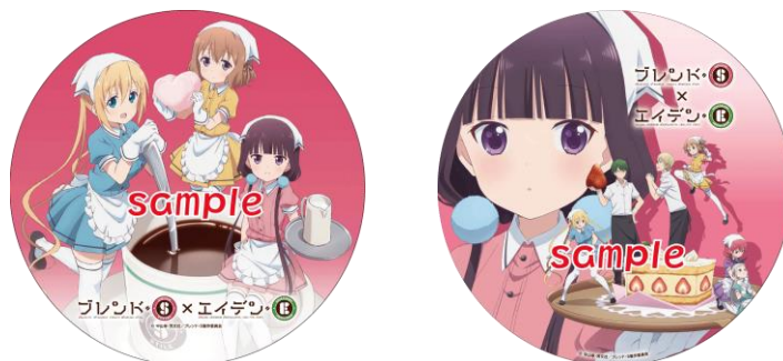
コラボヘッドマークのイメージ

※運転時間は日によって異なります。また、車両点検やその他の理由により運休や運行期間終了日を変更することがありますのであらかじめご了承ください。