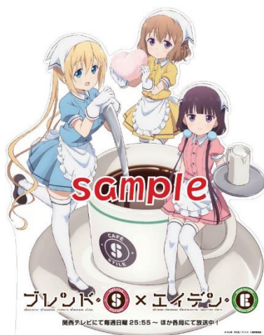
スタンディのイメージ