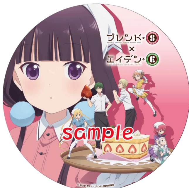
コラボヘッドマークのイメージ