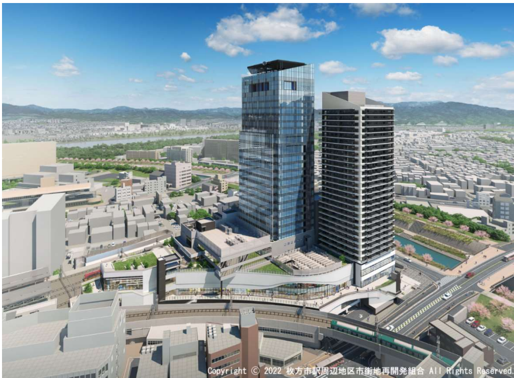
第3工区 完成イメージ

京阪グループでは、長期経営戦略における主軸戦略の一つとして「沿線再耕」を掲げており、その中でも枚方市駅および周辺エリアにつきましては、「えきから始まるまちづくり」の方針のもと、駅の魅力・価値向上と駅周辺への都市機能の集積、地域の特色を活かしたまちづくりの実現を目指し、枚方市駅周辺地区第一種市街地再開発事業に参画しています。