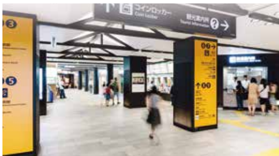
祇園四条駅(京阪電気鉄道)

大阪・京都・滋賀の都市間輸送を担い、通勤・通学アクセスとして、また、大阪・京都やびわ湖への観光アクセスとしてご利用いただいている京阪電車をはじめ、洛北を走る叡山電車、京都・嵐山に延び「嵐電」の愛称で親しまれている京福電車を運行しています。安全安心な運行を守るべく、安全設備の充実や日常のメンテナンスを徹底しているほか、多様な訓練を実施することで緊急時にも備えています。また、より便利・快適にご利用いただくべく、車両や駅などのリニューアルに取り組んでいるほか、接客レベル向上のためのCS研修を実施し、きめ細かなご案内にも努めるなど、ハード・ソフト両面からさまざまな取り組みを行っています。