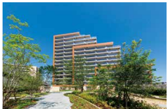
ファインシティ枚方

関西圏を中心に、マンション事業・戸建事業・仲介事業およびリフォーム事業を展開しています。マンション事業では、オリジナルブランド「ファイン」シリーズや他社と共同での大規模分譲を展開。首都圏や札幌でもマンション分譲を行うなど、沿線の付加価値向上に軸足を置きつつも、多角的に事業を推進しています。