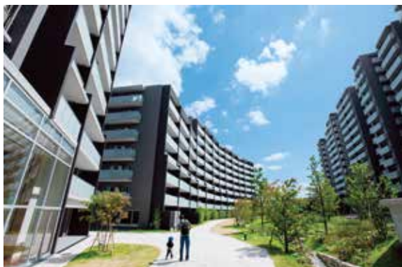
ファインガーデンスクエア(京阪東ローズタウン)

「くずはローズタウン」「びわ湖ローズタウン」「京阪東ローズタウン」をはじめ、「京阪東御蔵山住宅地」「けいはんな公園都市」など、交通機関と商業施設、コミュニティ施設を組み合わせたトータルな街づくりを行っています。