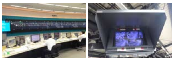
自律分散式列車運行管理システム(ADEC) ハイビジョン監視用テレビ装置