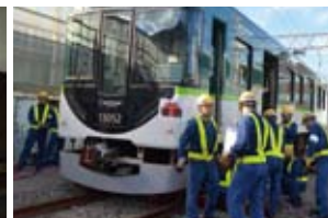
総合事故復旧訓練