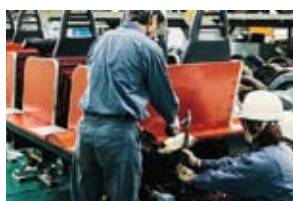
ジェットコースターの分解整備

鉄道会社直営の強みを活かし、鉄道車両で実施する検査等を遊戯機に応用することで、高い技術レベルでの安全確保に取り組んでいます。