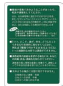
コンプライアンス・ホットラインカード

通報者の個人情報厳重に保護され、コンプライアンス・ホットライン関与者など限定された者以外に開示されることはなく、通報行為によって不利益な処遇を受けることはありません。