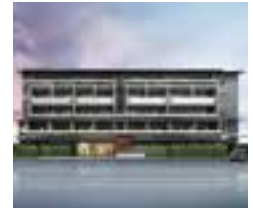
ザ・京都レジデンス 御所西 乾御門