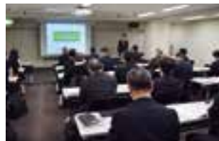
環境法規制セミナー