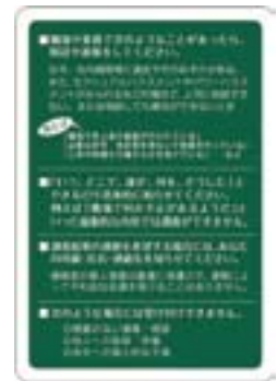
コンプライアンス・ホットラインカード

通報者の個人情報には厳重に保護され、コンプライアンス・ホットライン関与者など限定された者以外に開示されることはなく、通報行為によって不利益な処遇を受けることはありません。