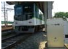
フラット検出装置

線路上に設置される「フラット検出装置」は通過列車の車輪踏面の不具合を自動的に車輪単位で早期に発見するための装置です。現在の装置は、平成13年に寝屋川車両基地横に設置され、平成15年より本格的に運用を開始しました。全通過列車の車輪振動および騒音データの中から、基準値を超えた車輪の削正手配を速やかに実施し、乗り心地の改善や走行騒音の低減を効率的に行っています。