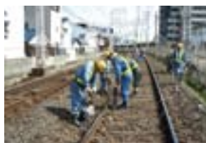
道床つき固め作業

この変状を保守用車（マルチプルタイタンパー）で正しい位置に復元し、同時にまくらぎ下の砕石をつき固めることによって、乗り心地や騒音・振動の改善を図っています。