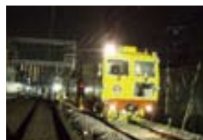
マルチプルタイタンパー