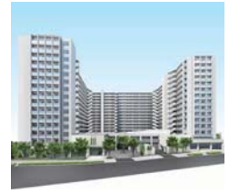
ファインシティ大阪城公園