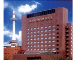
京都センチュリーホテル