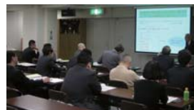
環境法規制セミナー