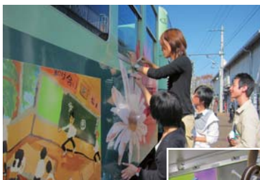
「石坂線みんなで文化祭号」の創作風景

イベント電車として「落語電車」、「おもいでお花見電車」、大津線沿線の学校や施設の美術作品を電車内外に展示した「石坂線みんなで文化祭号」を運転しました。また、ラッピング電車にも力を入れており、平成9年以降、デザイン学校や地域、大津線を応援して下さるNPOの皆さまと協力して季節の雰囲気を盛り上げ、地域の活性化に取り組んでいます。