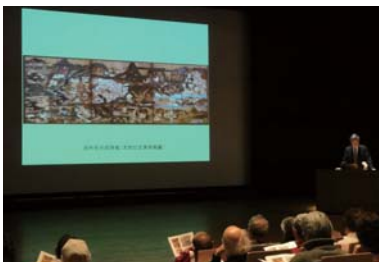
第28回 京阪・文化フォーラム