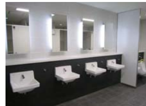
枚方市駅内の女性用トイレ

快適性の向上を図るため、洋式便器を拡充するとともにウォシュレットを採用しました。また、お子さま連れの方のためにベビーシートをはじめとした幼児用設備を拡充したほか、地球環境への配慮としてLED照明や超節水小便器をはじめとした節水型器具を採用しました。