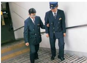
ヒューマンサポート研修

障がいのあるお客さまも快適に駅をご利用いただけるように新入社員にヒューマンサポート研修を実施しています。車いす、アイマスクなどを用いた実習を通じて、身体の不自由なお客さまが駅をご利用される際に感じる不自由さを知り、より良いサービスを提供できるよう努めることを目的としています。