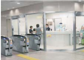
けいはんインフォステーション

京阪線の主要駅に「けいはんインフォステーション」を設置しています。列車ダイヤ、運賃、お忘れ物や駅周辺のご案内など、さまざまなお問い合わせにおこたえしています。