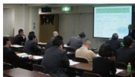
環境法規制セミナー